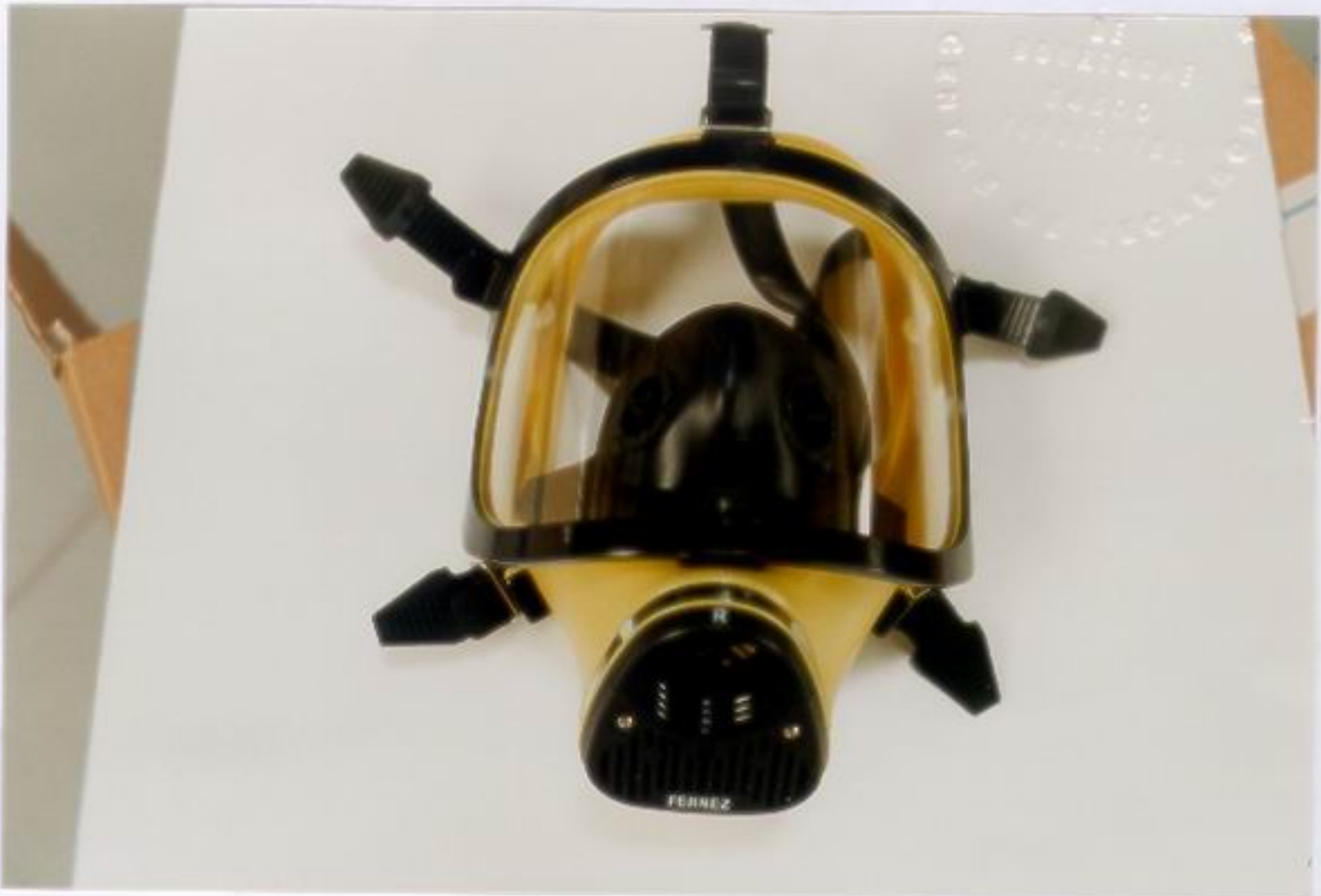
Photographie de l'équipement